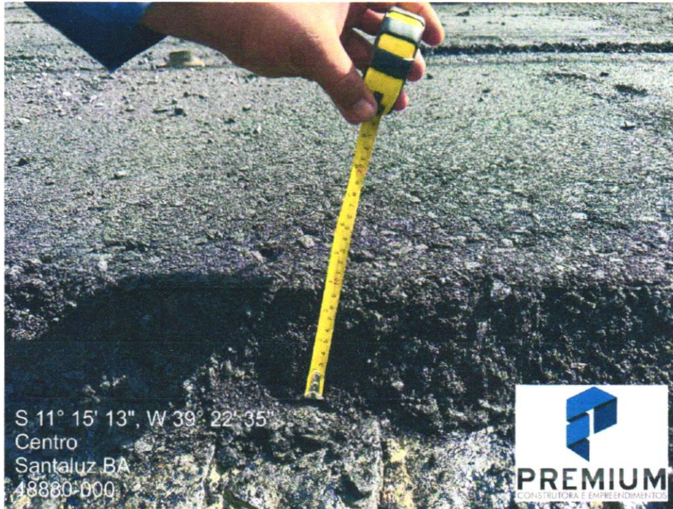
Foto 01- Espessura da massa asfáltica.