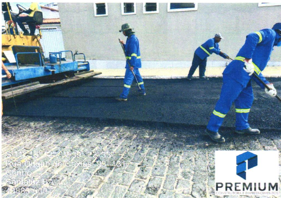
Foto 02- massa asfáltica.